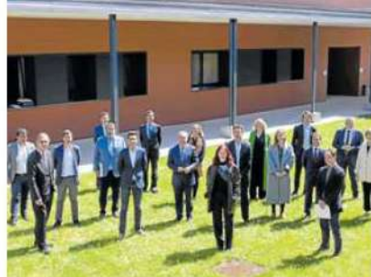
Asistentes al acto posan en el Campus de la Universidad de Deusto.