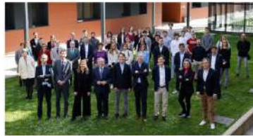
Diecisiete jóvenes y una quincena de empresas han participado en la tercera edición del "Programa Inmersión en Empresa Familiar"