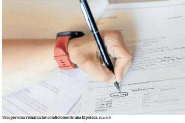
Una persona remarca las condiciones de una hipoteca.

El dato a nivel estatal es de 6,7 años, cuatro meses más respecto al año anterior (6,3 años), pero casi un año más que en 2019, cuando se destinaba el sueldo íntegro de 5,8 años para el pago de una hipoteca. “El esfuerzo salarial que un ciudadano debe realizar para comprar una vivienda está en las cotas más altas de la última década. Evidentemente el precio de la vivienda no ha crecido al mismo ritmo que los salarios desde la recuperación económica de 2014, pero es resaltable que el encarecimiento ha aumentado exponencialmente en los últimos dos años”, explicó ayer la directora de Estudios y portavoz de Fotocasa, María Matos. Así, Matos recalcó que la subida de los tipos de interés es la principal razón que ha perjudicado la accesibilidad a la compra de una vivienda en el Estado. En 2023 el precio de la vivienda en venta en España se situó en 2.203 euros por metro cuadrado,